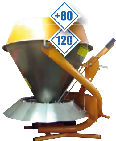
ENS 203 inox