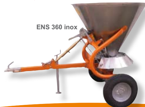
ENS 360 inox